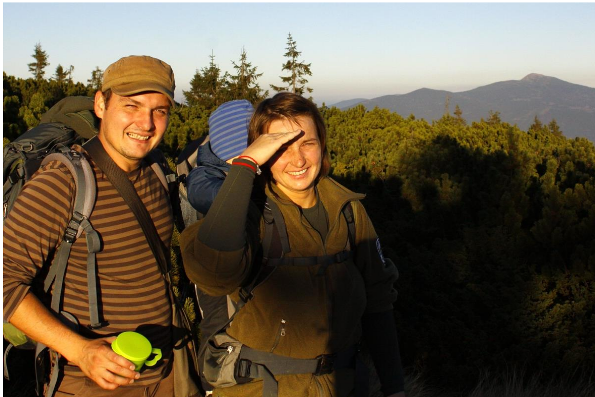
Výstup na Pilsko s manželkou Zuzkou (tiež absolventka FEE)

Záujemcom o štúdium by som odkázal, že ak ich to ozaj baví, tak hurá do štúdia na FEE. Je to zaujímavá škola, ktorá ak má študent záujem, môže ho veľa naučiť. A študentom FEE asi len to, aby trávili čo najviac času v teréne, pretože "V tieni stromov sa naučíš to, čo sa nikdy nenaučíš v škole" – St. Bernard of Clairvaux.