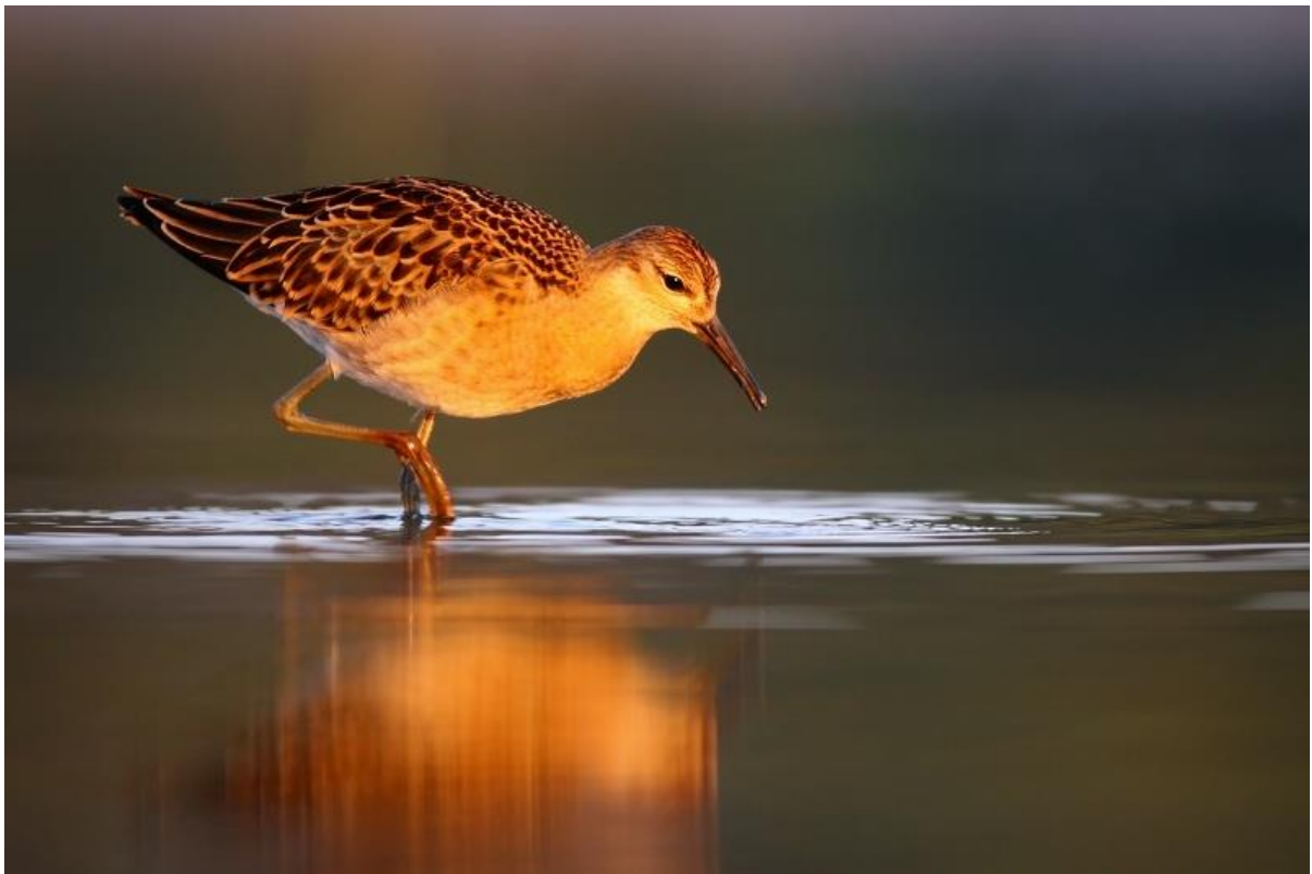
Pobřežník bojovný (foto Šimon Kertys)