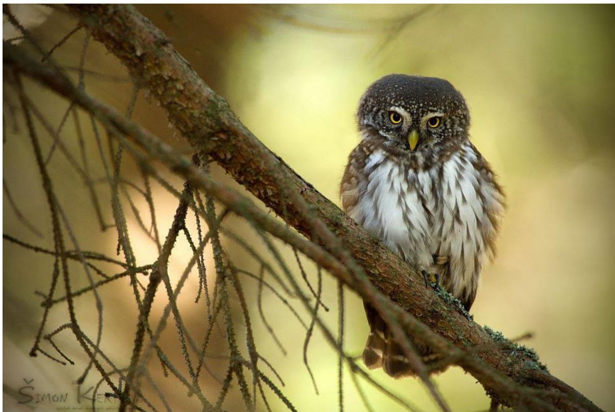
Kuvičok vrabčí