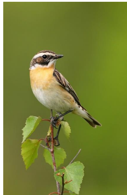
Prhľaviar červenkastý

http://www.ifwp-photo.org/ifwp-competition/2012